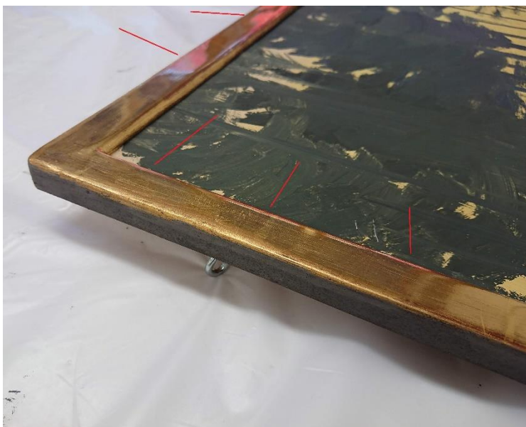
Bild ovan: Uppkittade delar som tonats in med infärgat latexkitt.

Lösa kanter och vid bortfall samt pågående släpp injicerades MFK, Medium for consolidation och limmet värmdes sedan fast lösa förgyllningar och färg. Bortfall kittades upp med latexkitt som pigmenterats med obränd terra till bolusens(förgyllningsgrundens) rosaaktiga kulör. Sedan tonades dessa in i rätt guldton med Goldfinger, Daler & Rowney, guldpasta. En skyddande fernissa med Dammarharts löst i Shellsoll lades över retuscheringarna. Färgbortfallen på den grå kanten retuscherades med akrylfärg i konstnärskvalité. Mindre fläckar på målningen togs bort med bunden fukt och nonjon tensid.