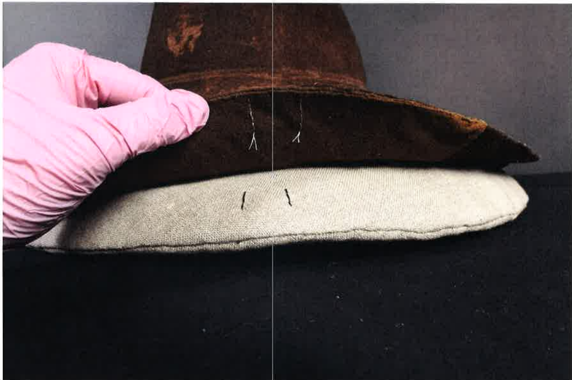
Markeringar för att underlätta placering i rätt läge