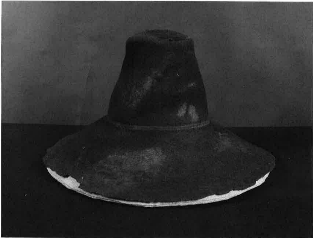
Hatt Vbm8027 på sitt nya stöd