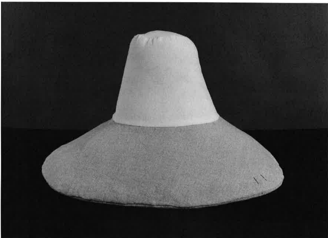
Nytt stöd. Bomullstuskraft i kullen och oblekt linnetuskraft i brätte