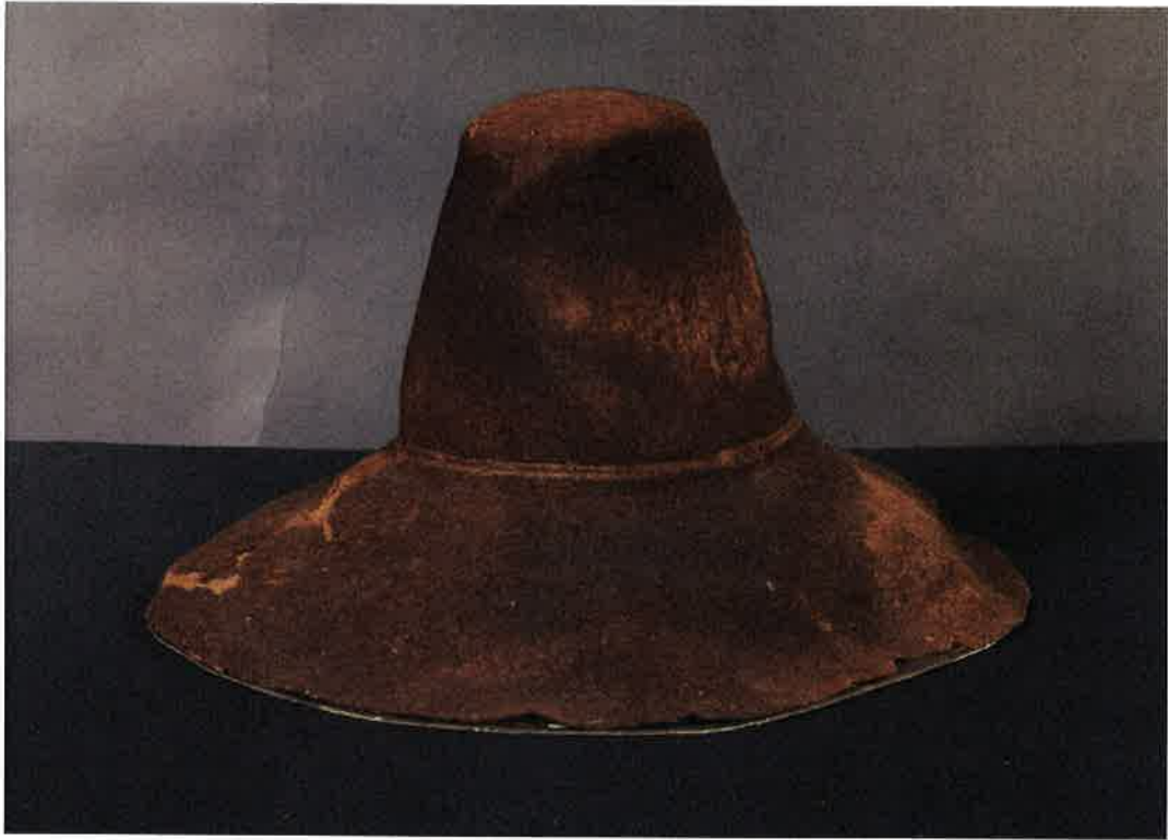
Hatt Vbm8027 på sin tidigare montering